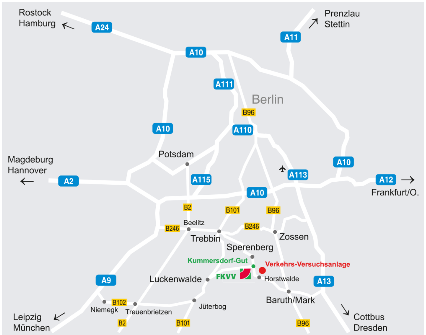
Abb. 2: Lageskizze von Verkehrs-Versuchsanlage Horstwalde und Geschäftsstelle FKVV